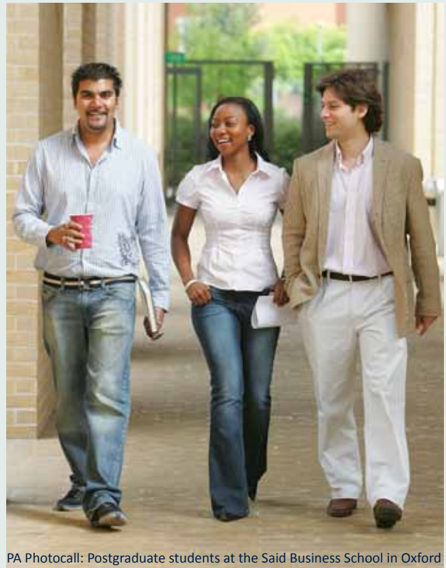
Postgraduate students at the Said Business School in Oxford

L'Institut des migrations internationales est membre de l'Oxford Martin School, une initiative de recherche pluridisciplinaire conçue pour aborder les défis mondiaux à venir. L'IMI s'engage à développer une perspective à long terme et tournée vers l'avenir